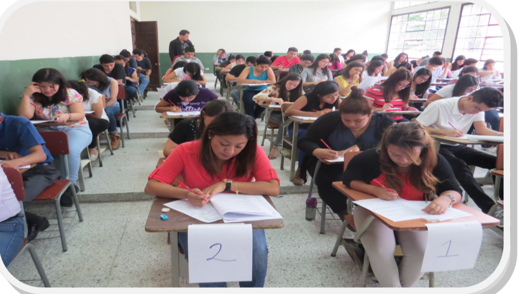
Aula 4 del Edificio Histórico de esta Facultad