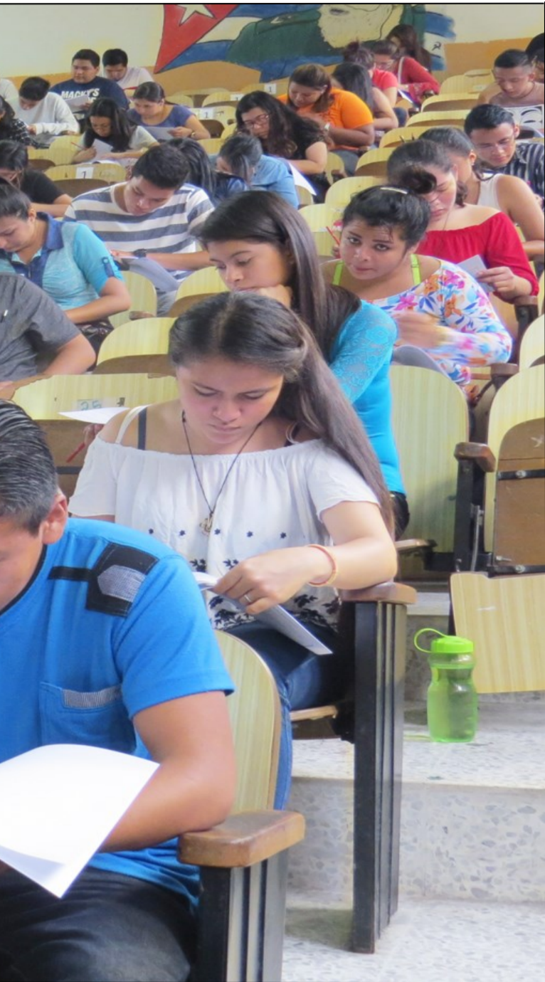
Auditorio Herbeth Anaya Sanabria de la Facultad de Ju- risprudencia y Ciencias Socia- les, recibe a aspi- rantes a estudiar la Licenciatura en Ciencias Jurí- dicas y la Licen- ciatura en Relac- iones Inter- nacionales