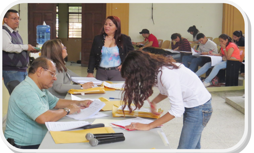
Decana de la Facultad observa el desarrollo de la jornada