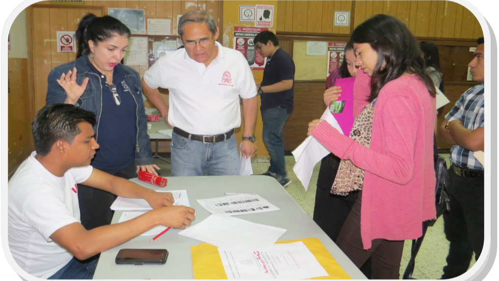
Vicedecano de esta Facultad, durante la entrega de documentos