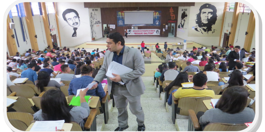
Entrega de examen de parte de profesores de la Facultad